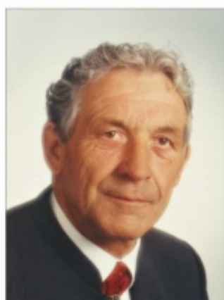
Steingaden, im August 2019

In Dankbarkeit nehmen wir Abschied von meinem Vater, unserem Schwiegervater, Opa, Uropa, Lebensgefährtin, Bruder und Onkel