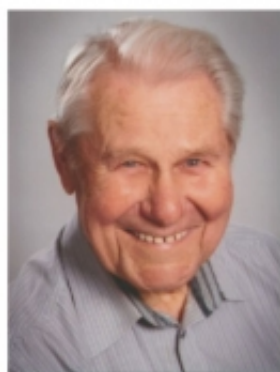
Burgen, im April 2023

Nach einem langen und erfüllten Leben nehmen wir Abschied von